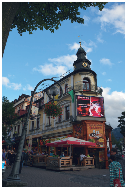
Fot. 1. Dawny hotel „Centralny”, ul. Krupówki 28