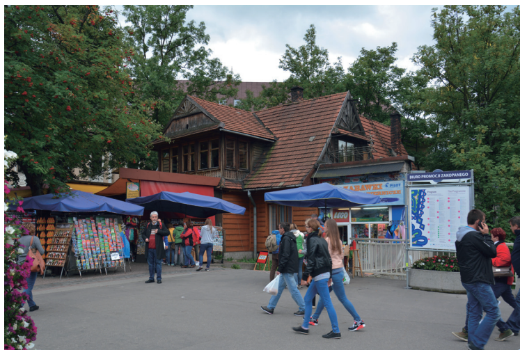
Fot. 2. Willa „Wenecja”, ul. Krupówki 2