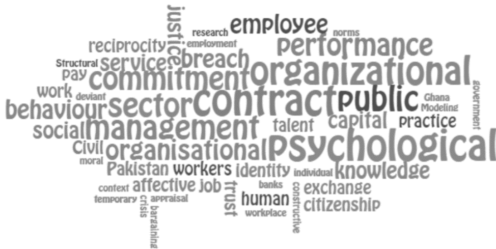
Rysunek 1. Chmura słów – analiza frekwencyjności słów kluczowych